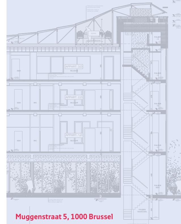
Muggenstraat 5, 1000 Brussel